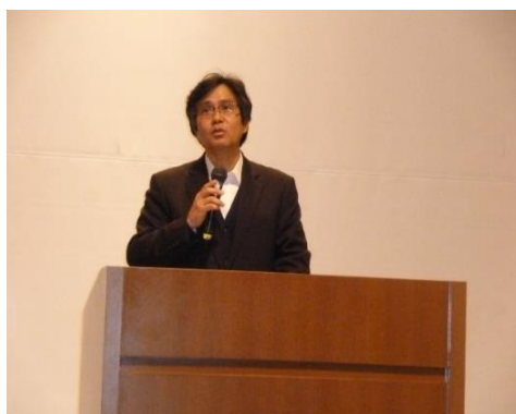
講演会にあたり主催者挨拶をする 香月副理事長