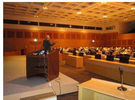
〈技術講演の聴講風景〉