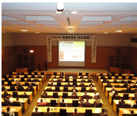
～平成29年度技術講演会～ 開催状況